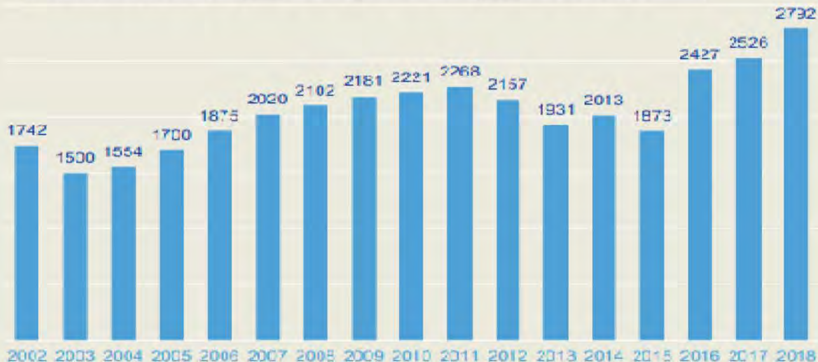
Numărul orașelor participante la Campania SEM, în perioada 2002-2018